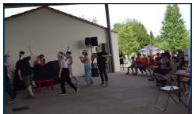
L'atelier Ados de La Fabrique des échos a joué un extrait de la pièce présentée les 18 et 19 juin à la salle des fêtes