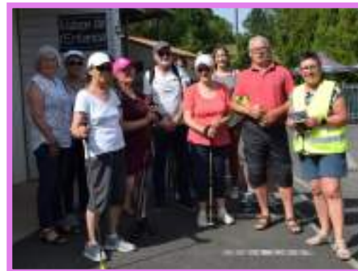
Un groupe de marcheurs a effectué le parcours concocté par la commission des sentiers pédestres