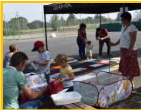
L'association des assistantes maternelles a proposé un parcours sensoriel et une pêche à la ligne