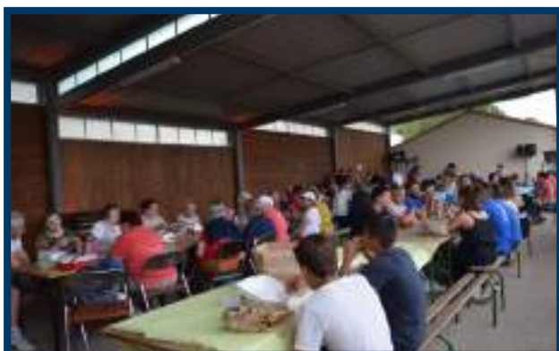
Les tables installées sous le préau étaient à la disposition de chacun pour un pique-nique convivial.