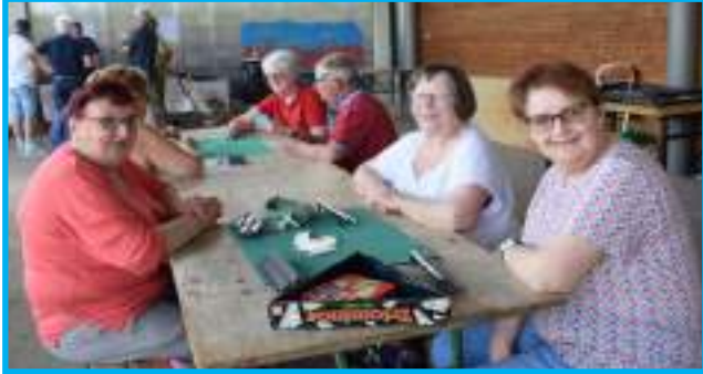
Les tables mises à disposition ont permis aux amateurs de faire des jeux de société

Le samedi 21 mai, après 2 ans sans possibilité de se réunir, les Pissottais sont venus nombreux à la grande fête des voisins organisée par les élus dans le secteur périscolaire.