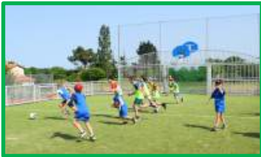
L'ESV a organisé des mini tournois sur le city stade pour les jeunes amateurs de football.