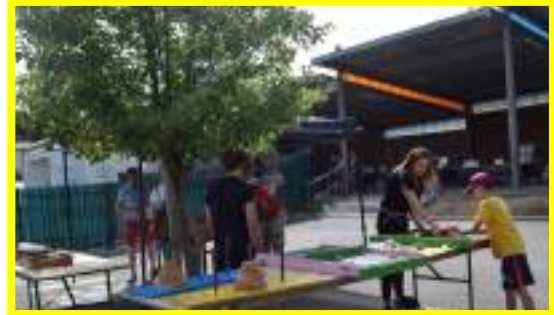
L'après-midi, plusieurs associations ont proposé des jeux et activités pour toute la famille