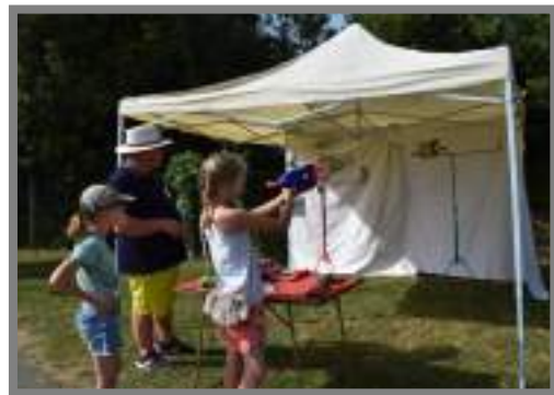
Tir aux Pigeons par L'Union des Chasseurs